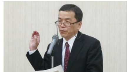
杉山上席調査官による説明