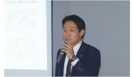
椎野先生による説明