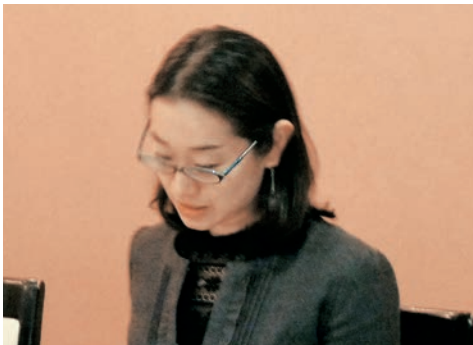
細永先生による説明