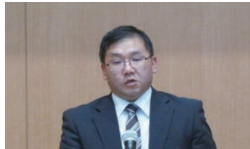
吉村上席調査官による説明