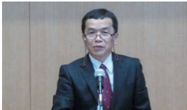
杉山上席調査官による説明