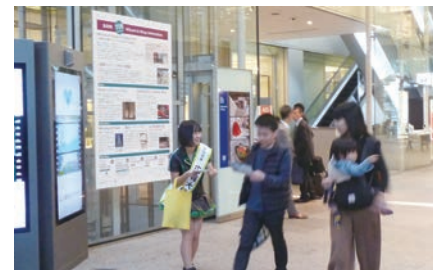
全力少女Rによる活動