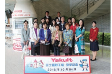
ヤクルト裾野工場で集合写真