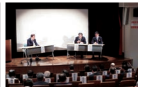
シンポジウムの様子