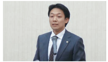
椎野先生による説明