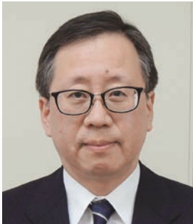
東京都千代田都税事務所長 大隈 雅英

皆様から信頼される 税務行政、税務署を 目指して 弛 たゆ まぬ努力を 重ねてまいります