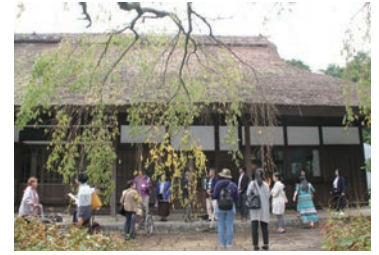
秩父宮記念公園見学中

ヤクルト裾野工場では、最初にビデオでの工場の概要説明をしていただきました。その後集合写真を撮り工場内へ入り、製造室、充填室等の製造工程を見学しました。