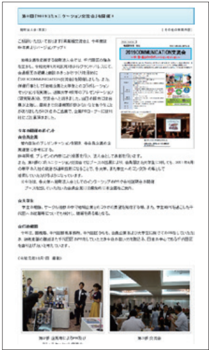
全国法人会連合会のWEBサイトに掲載