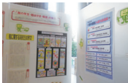
麹町区民館での展示