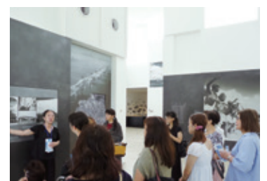
予科練平和記念館での見学の様子

その後集合写真を撮り工場内へ。はじめに製造室、充填室へ案内され、実際にどのように作られていくかを目で見ることができました。