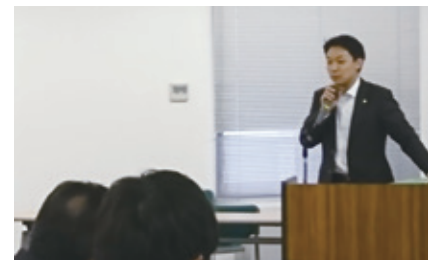
椎野先生による説明