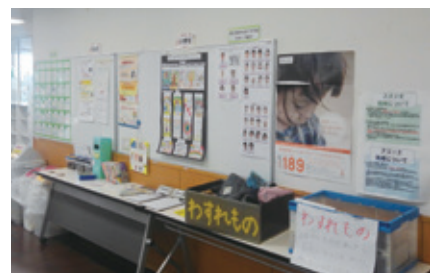
富士見わんぱく広場での展示