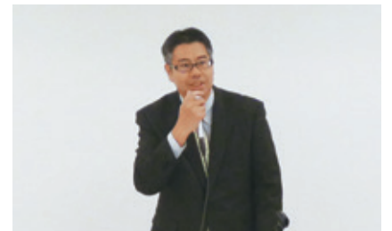
野田上席調査官による説明