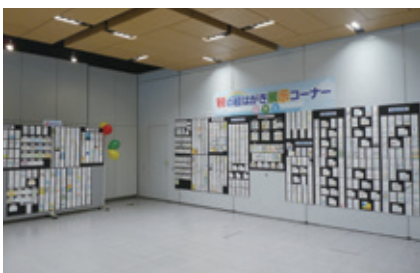
千代田区役所1階の展示