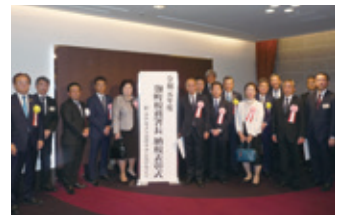
受彰者との集合写真