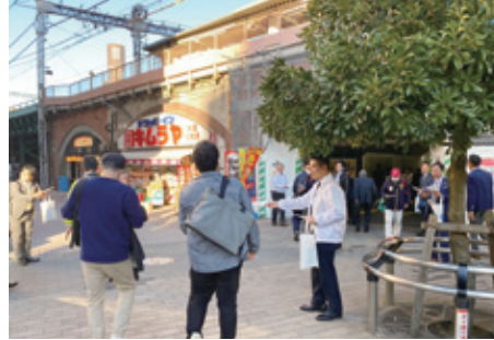
青年部会員による広報物配布