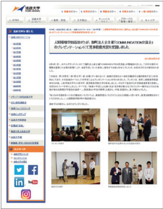
法政大学のWEBサイトに掲載