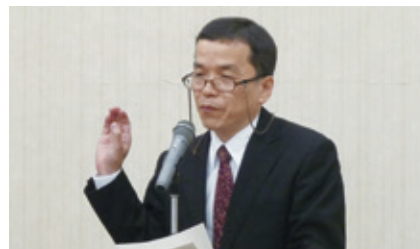
杉山上席調査官による説明