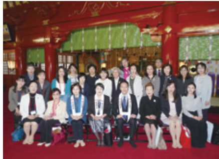
神田明神境内での集合写真