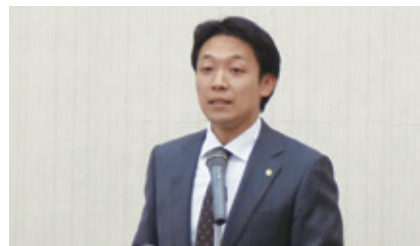
椎野先生による説明