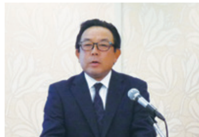
一ノ瀬署長による講演