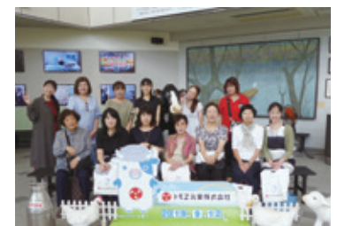
トモエ乳業(株)工場での集合写真