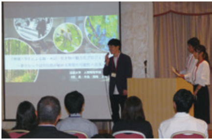
大学生のプレゼンテーションの様子