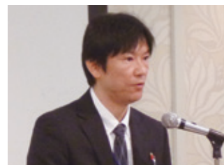
水本情報技術専門官