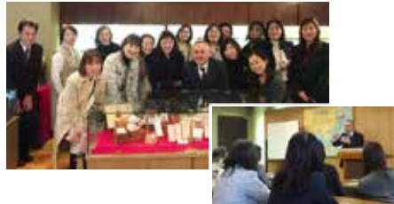
負野薫玉堂 講話と見学