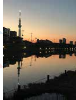
「夕映えの逆さツリー」