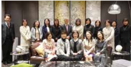
西陣織あさぎ美術館 ～ツカキスクエア7F～