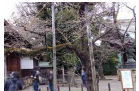
(東京 靖国神社境内 標本木)