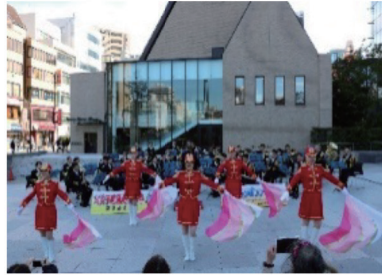
東京消防庁音楽隊演奏