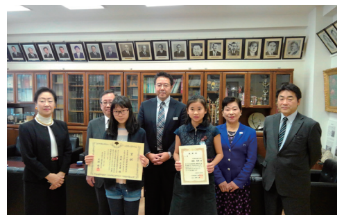
受賞生徒さんとの写真

女性部会では、租税教育の一貫として、区内小学校の児童(5~6年生)を対象に、「税に関する絵はがきコンクール」を開催いたしました。対象4校389点の応募があり、審査の結果、入賞作品が16点に絞られました。12月上旬、各学校の校長室にて表彰式を開催しました。