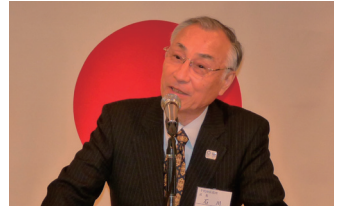
千代田区 石川区長