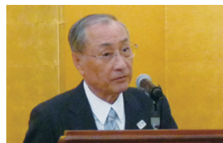
千代田区 石川区長