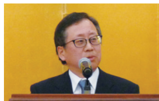
東京都千代田都税事務所 大隈所長