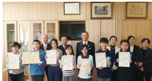
受賞生徒さんとの写真

12月上旬、富士見小学校、九段小学校、麹町小学校、番町小学校の校長室にて表彰式を開催しました。