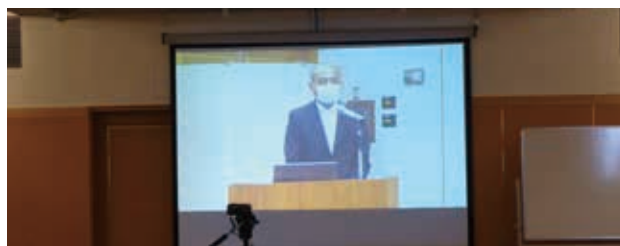
WEB参加者に向けて映像も同時配信