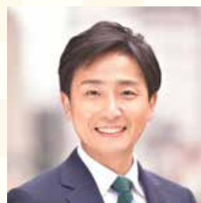
千代田区長 樋口 高顕

都民の皆様信頼される公正・ 公平な税務行政の実現と納税者 サービスの向上に本年も全力で 取り組みます。