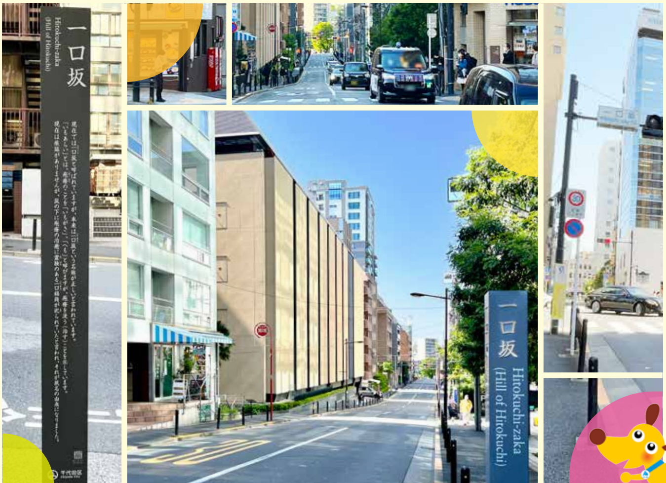
一口坂（九段北三丁目）