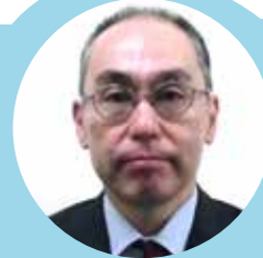
麴町税務署 法人第一部門 統括官

麴町法人会の皆様には、日頃から税務行政に対し多大なる御支援と御協力をいただいております。引き続き、厚く御礼申し上げます。1年間、皆様と共に励んでいきたいと考えておりますので、今後ともどうぞよろしくお願いいたします。