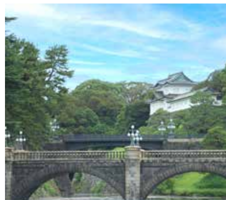
(皇居正門前 手前：正門石橋 奥：正門鉄橋)

その後、明治時代になると橋は鉄橋に建て替えられました。昭和には2回目の修繕が行われました。