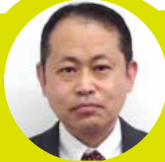
麴町税務署法人調査担当副署長

麴町法人会の皆様方には、平素から税務行政に対し深い御理解と多大な御協力を賜り、厚く御礼申し上げます。引き続き、法人税のALL e-Taxをはじめとする各税目のe-Tax利用及びキャッシュレス納付などの業務のデジタル化促進のお力添えを賜りますようお願い申し上げます。