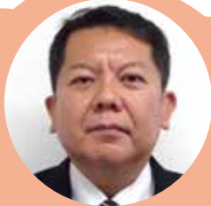
麴町税務署 法人担当副署長