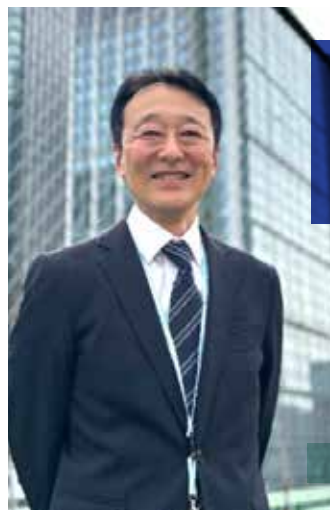
東京都 千代田都税事務所長