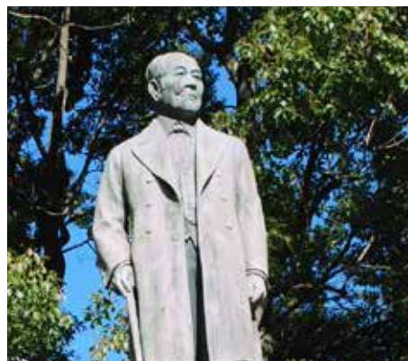
常磐橋公園の渋沢栄一像(大手町)

第二次世界大戦時に金属提供のため撤去されてしまいましたが、戦後再び朝倉文夫によって再建されています。