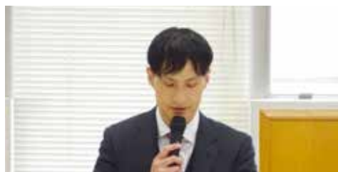
麹町税務署 一瀬上席調査官