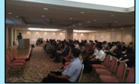
<コミュニケーション交流会概要>

①各大学の学生による、ゼミの発表、サークル発表、による会員企業との「コミュニケーション交流会」を開催し、経営者は若者の考え方に触れ、新規事業のアイデア等に繋げています。