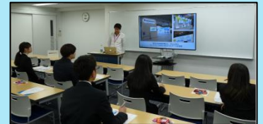
<学内の会社説明会>